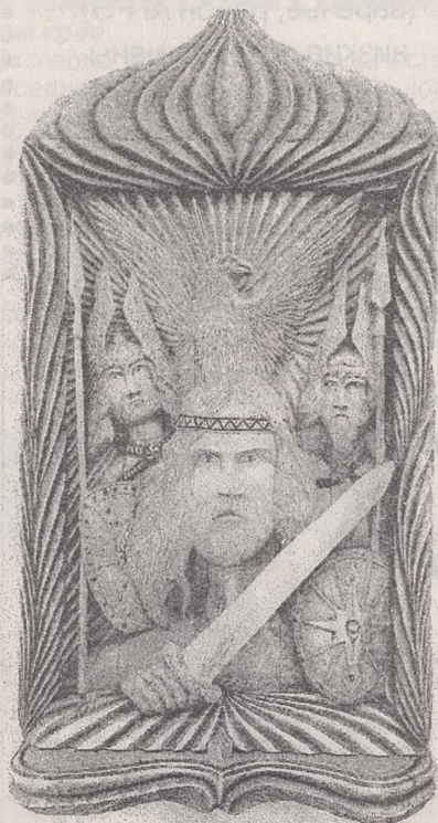
Работа Ю.В. Лактионова «Русичи», п. Мотыгино