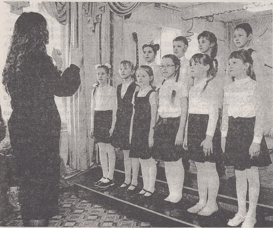
На концерте «Вдохновение», март 2017 года