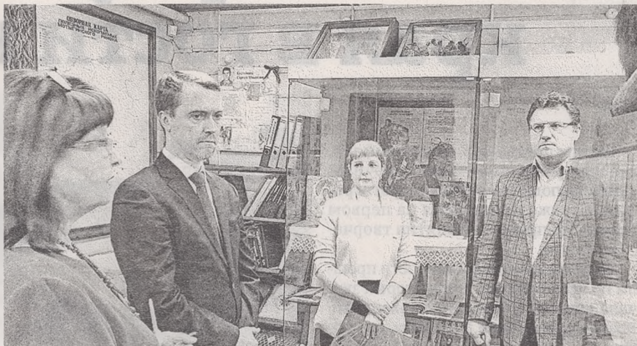
В Мотыгинском музее