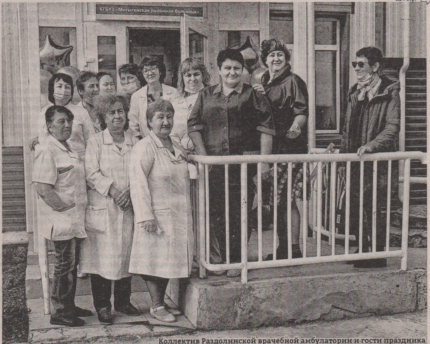
Коллектив Раздолинской врачебной амбулатории и гости праздника.